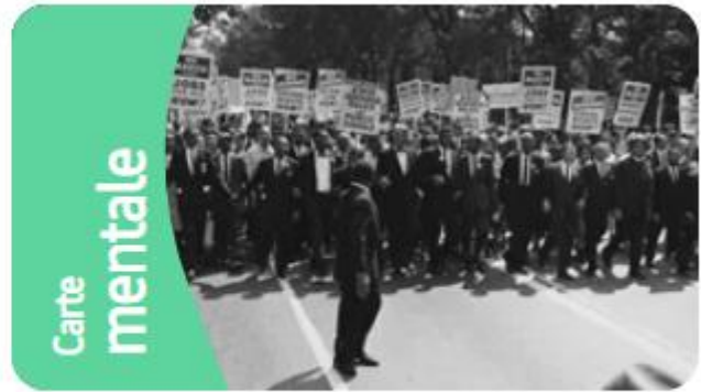
Martin Luther King : Un combat pour l'égalité